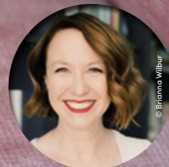
Die beliebte TikTok-Serie

Catalina King hat eine Mission: Sie will das traditionelle Weihnachtsfest der Kleinstadt Merry retten. Nachdem ein Sturm Merry übel verwüstet hat, möchte Catalina mit ihrer Reality-Show das historische Stadtzentrum renovieren. Der Haken? Noah Yates, mürrischer Bürgermeister und alleinerziehender Vater, will um jeden Preis verhindern, dass irgendwelche Mächtigen-Fernsehstars die Tragödie kapitalisieren. Aber Catalina »Cat« King gibt so schnell nicht auf. Jedes Mal, wenn Noah und Cat im selben Raum sind, fliegen die Fetzen. Können sie sich zusammenreißen, damit es ein Weihnachtswunder geben kann?